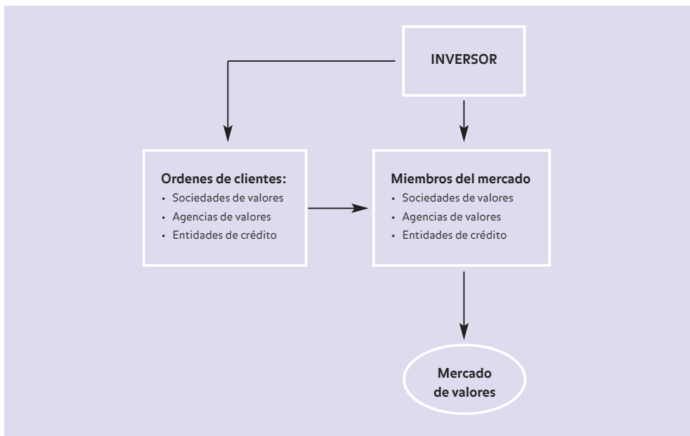
Gráfico 1. Transmisión de órdenes al mercado